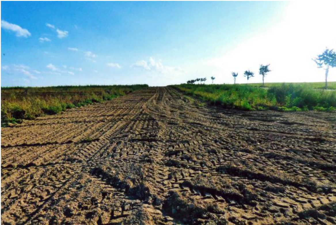
Abb. 1: Flächenvergeudung und Bodenverdichtung an den Vorgewenden bei industrieller Großraumlandwirtschaft

Wenn die Erhöhung des Humusgehaltes (schwer zersetzbare, organische Substanz) um ein Prozent - 30 t Humus/ha rund 64 t/ha CO 2 -Bindung entspricht, sind wir in der Lage, bei der Erhöhung des Humusspiegels um zwei bis drei Prozent zusätzlich 130 – 180 t CO 2 /ha zu binden.